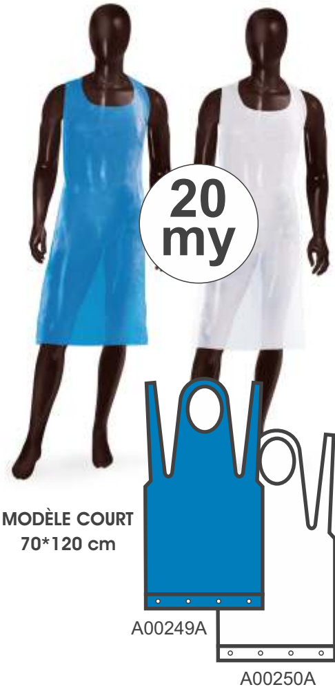
MODÈLE COURT 70*120 cm

100 pièces sur bloc Masterbox 10 blocs *100 = 1000 pièces